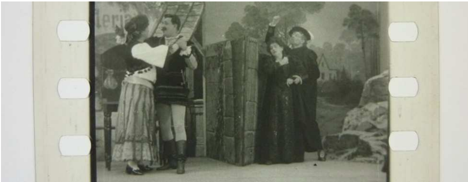
Bild links: Tonbild zu RIGOLETTO: Quartett No. 77 (Deutsche Bioscop, DE 1909)

Unterstützt durch die Beauftragte der Bundesregierung für Kultur und Medien